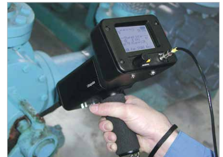
Pruebas/Tendencias en todo tipo de maquinaria

Un método único es también utilizado en intercambiadores de calor, este es el método de tonos que consiste en inundar la carcasa principal del equipo con una poderosa señal ultrasónica de alta frecuencia. El sonido generado buscará una salida a través de los tubos. Un simple escaneo en el espejo de tubos mostrará los que tengan fuga.