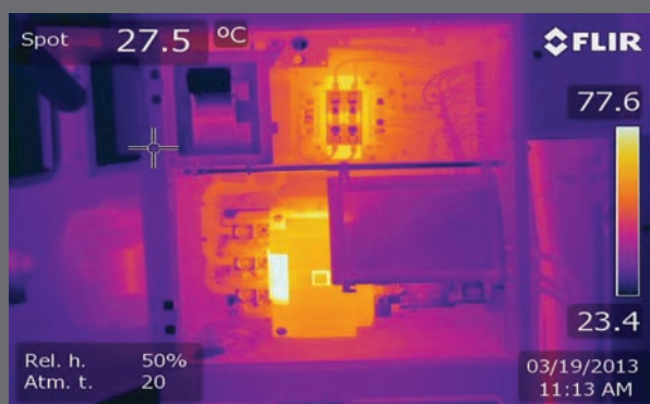
Terzo caso. Una seconda ispezione ad infrarossi su un contatore parte di un motore orbitale ha confermato la presenza di tracking come precedentemente rilevato dagli ultrasuoni

possibile vedere ciò che viene definito contenuto in frequenza. Il contenuto in frequenza è molto semplicemente l'attività armonica tra le armoniche dominanti. Al peggiorare delle condizioni, si verificherà una perdita dell'armonica dominante a 60 Hz, nonché una diminuzione dell'uniformità d'ampiezza dell'ultrasuono registrato.