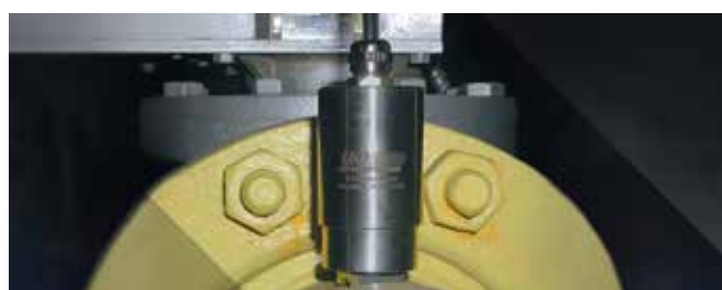
Capteur à ultrasons Ultratrak – UESystems – Surveillance cavitation de pompe

Les effets de cavitation dans une pompe précédemment décrits ont la particularité de générer des turbulences ultrasonores détectés par les capteurs Ultratrak de la gamme UESystems.