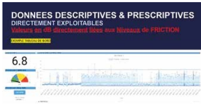
Exemple de tableau de bord de suivi : surveillance permanente de la pompe via le système connecté Ontrak et la plateforme de suivi UE Insight

Suite au paramétrage du système et à la mise en place de valeurs de références, de niveaux de pré-alarmes et d'alarmes, les maintenanciers et exploitants seront alertés en temps réel dès lors que des signes avant-coureurs de défaillances apparaissent.