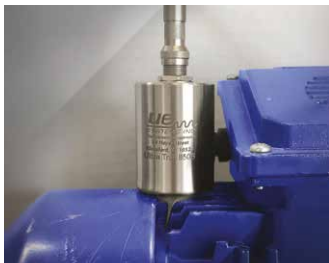
Capteur à ultrasons Ultratrak 850S permettant de surveiller le roulement du moteur de la pompe

Les données fournies par les capteurs étant exprimées en décibels, elles sont faciles à interpréter. Lorsque cette valeur mesurée en temps réel dépasse un certain seuil par rapport à la valeur de référence, une alarme est envoyée.