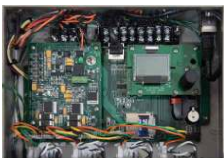
UE 4Cast öppnade lådkretsar