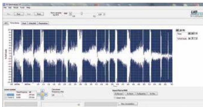
UE SPECTRALYZER™ – Programvara för spektralanalys (skärmdump av filen tidsserier)